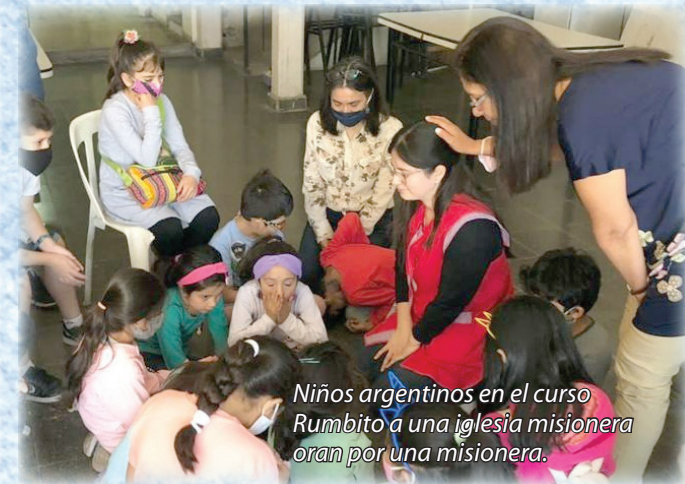
Niños argentinos en el curso Rumbito a una iglesia misionera oran por una misionera.